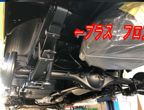
←プラス フロア全体施工